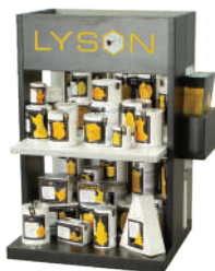
SMALL / MINI / МИНИ (dimensions / размеры: 65,5 × 51,5 × 38 cm)