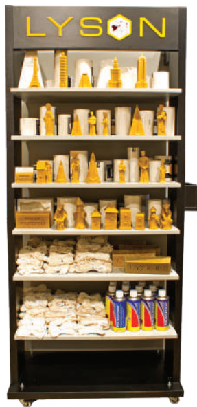
LARGE / MAXI / МАКСИ (dimensions / размеры: 190 × 90 × 40 cm)