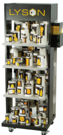
MEDIUM / MIDI / МИДИ (dimensions / размеры: 120 × 51 × 40 cm)